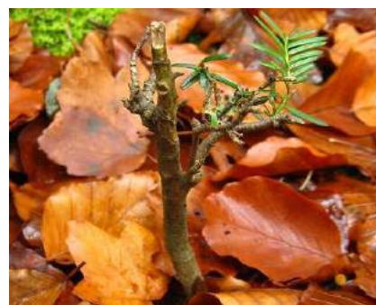
Jeune if victime d'abrutissement quasi létal