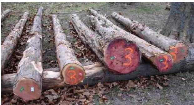
Eiben mit einem Mittelpreis von CHF 700.-/m 3

Ausrüstung : Wanderschuhe und der Witterung angepasste Bekleidung