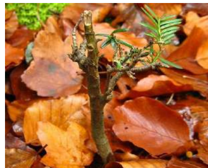
Junge fast zu Tode abgeästete Eibe