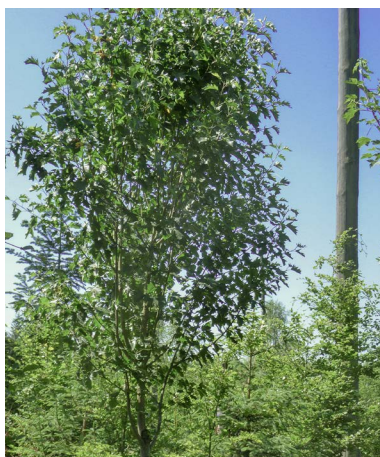
Mit weiterer gezielter Jungwaldpflege wird diese vitale junge Elsbeere ein Samenbaum für den Wald der Zukunft.

Schlüssel für eine erfolgreiche Anpassung durch Naturverjüngung sind Samenbäume von geeigneten Baumarten. Damit ein Baum fruktifiziert und somit auch tatsächlich zum Samenbaum wird, muss er generell herrschend und in der Oberschicht sein sowie eine gut ausgebildete Krone haben. So können zum Beispiel Buchen des Nebenbestandes nicht fruktifizieren. Entscheidend ist also nicht eine möglichst