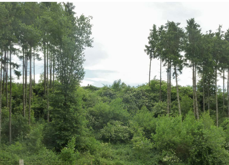
Fichten im Stress: Diesen rund 40 Jahre alten Bestand muss man vermutlich vorzeitig ernten.

den Grundsätzen der biologischen Rationalisierung effizient gepflegt wurden, absterben, ist der Verlust kleiner. Oft wären ohne flächige Pflege auch noch Mischbaumarten vorhanden, die nur scheinbar weniger wertvoll sind.