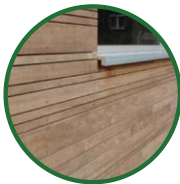
Thermo-Aspe als Fassadenholz geeignet.

Auch bezüglich flachgründigen Hangrutschungen könnte die Aspe wertvoll sein. Die Armierung des Bodens durch Wurzeln bewirkt sogenannte «Wurzelverstärkungen». Junge Aspen legen zuerst eine Pfahlwurzel an und bilden später kräftige Hauptseitenwurzeln aus. Dabei könnte das überaus rasche Wachstum ein Vorteil sein. Berechnungen der Wurzelverstärkung für Aspen in Neuseeland zeigen sehr gute Werte. In der Schweiz soll die Aspe diesbezüglich noch besser untersucht werden. ■