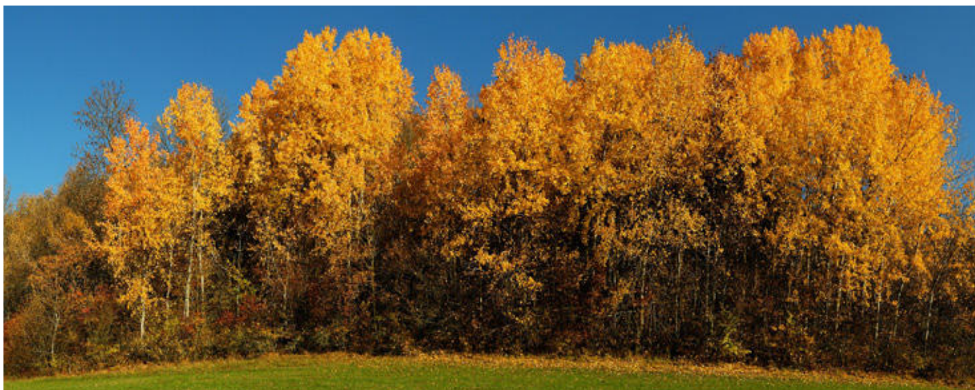
Die Aspe besticht durch ihre Herbstfarben und ist, gerade wenn sie in Gruppen steht, eine Augenweide.