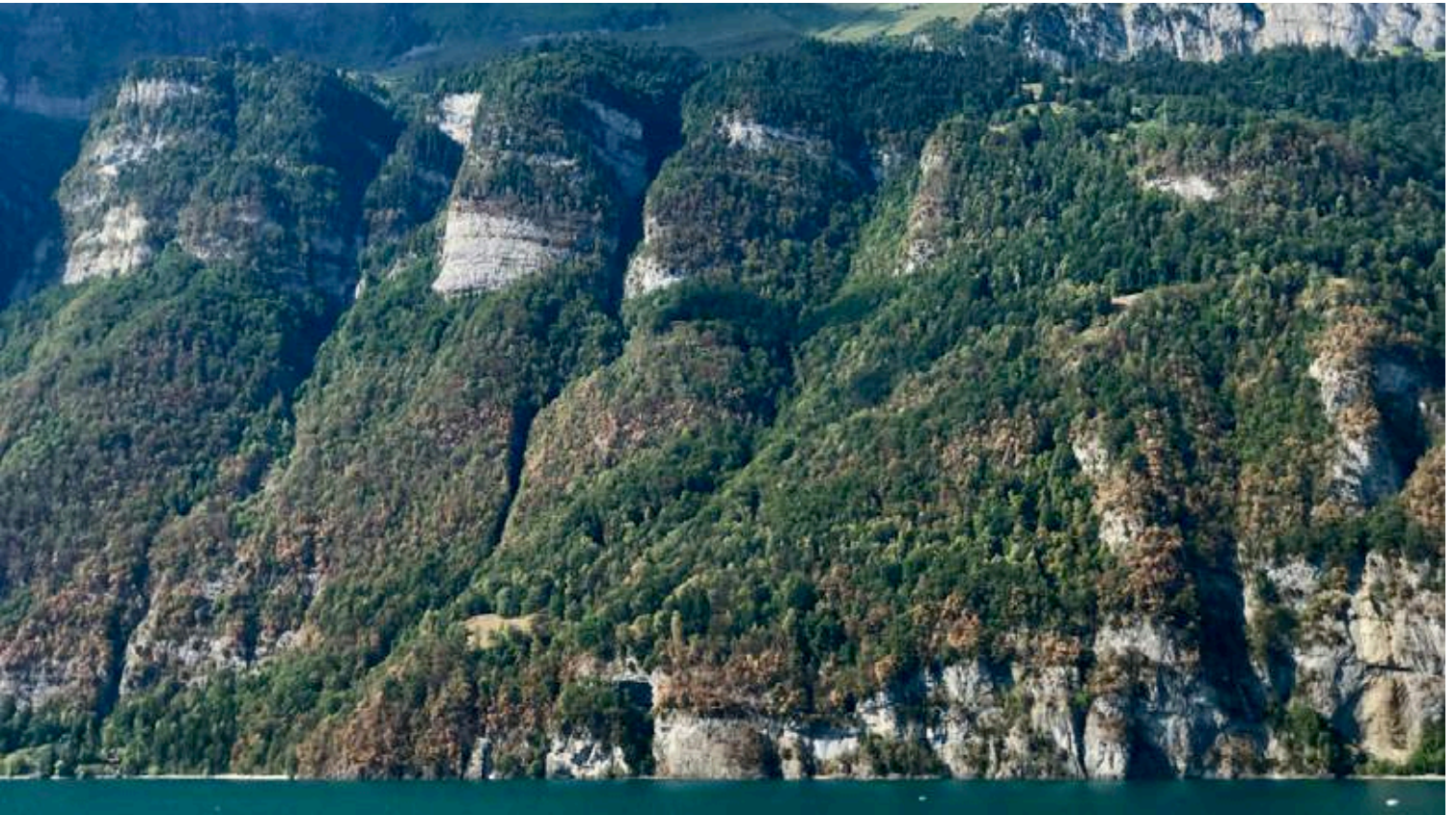
Abbildung 1: Am Walensee warfen viele Laubbäume im August 2018 aufgrund der starken Trockenheit ihre Blätter ab.