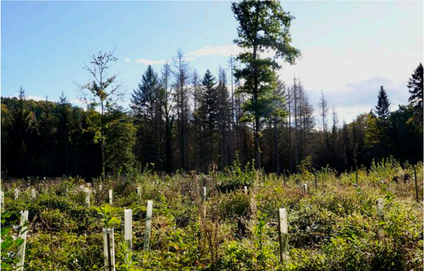
Abbildung 3: Gepflanzte Eichen mit Einzelschutz vor Wildverbiss im Mittelland. Im Hintergrund abgestorbene Fichten.