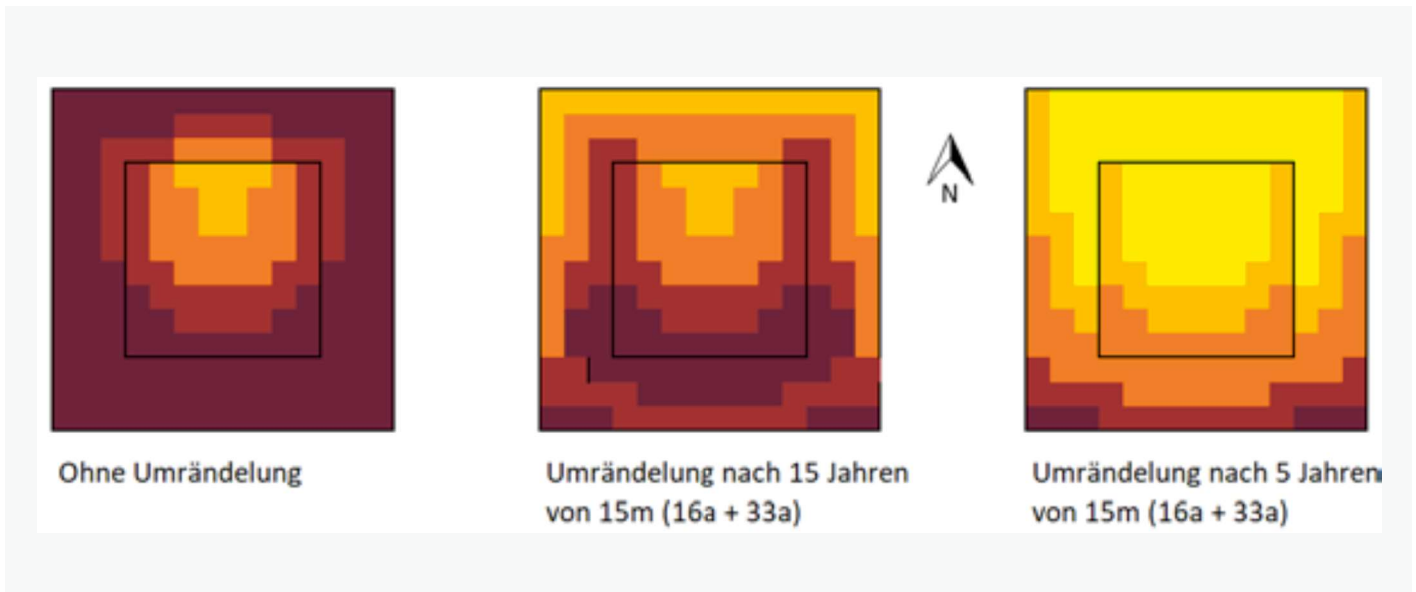
Abbildung 5: Effekt (gutachtlich) der zeitlich variierten Erweiterung von Lücken auf die Möglichkeiten der Verjüngung von Lichtbaumarten

initialen Teil der Verjüngung verbessert sich das Lichtangebot, wodurch in diesem noch jungen Bestand vorhandene Lichtbaumarten bessere Chancen bekommen.